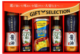
オリーブ&調味料バラエティ ギフト