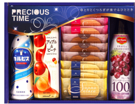
カルピス&デルモンテバラエ ティギフト