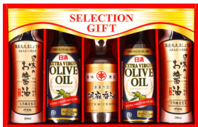
調味料バラエティギフト