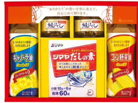
調味料セレクトギフト