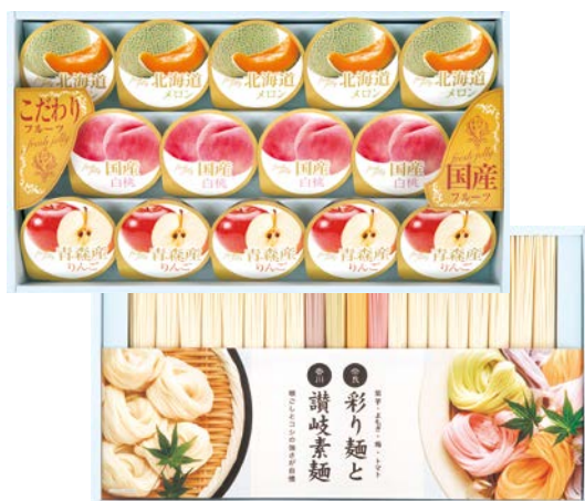
313 彩り麺と讃岐素麺&国産果汁ゼリーギフト

SBC-60AS 物流No.419278 ケース入数:4 本体価格 6,000円 (税込価格 6,480円 ) JAN:4550557898033 寸法:D345×W268×H147mm ニススイ紅ずわいがに55g、真ほっけ焼きほぐし40g、白子(わさび茶漬3.3g×3袋・味のり(8切5枚)×2)、讃岐うどん(180g・320g)、鮭ほぐし40g、鯖ほぐし40g、牛肉と椎茸のしぐれ煮55g、マルトモかつおパック(1.5g×4P)、信州そば(180g・280g)