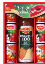
りんごジュース&デルモンテ飲料