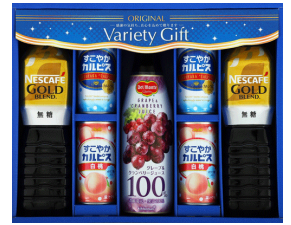
コーヒー&100%果汁飲料 ギフト