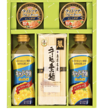
島原名産手延べ素麺&オイル バラエティギフト