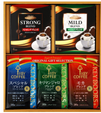
キーコーヒーバラエティギフト