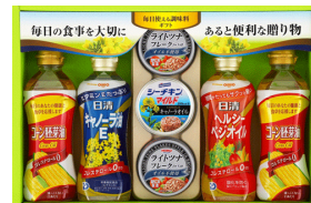
日清オイル&宝幸シーフード バラエティギフト