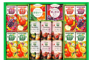
カゴメ野菜生活100スム ージー&杉本屋ゼリーギ フト