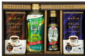
A G F ドリップコーヒー&日 清オリーブバラエティ