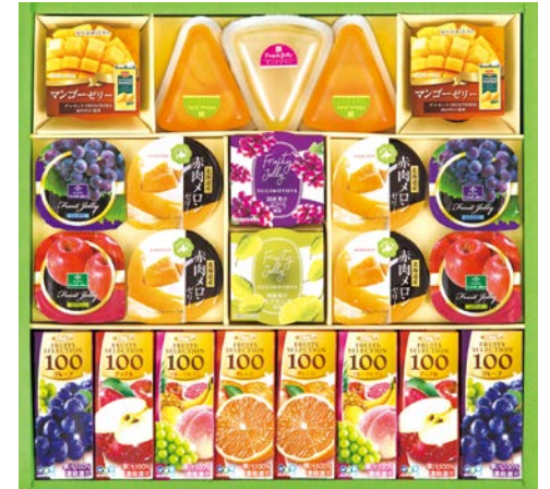
323 ゼリー&果汁飲料バラエティギフト

RIN-21 物流No.419561 ケース入数:6 本体価格 2,100円 (税込価格) 2,268円 JAN:4550557898057 寸法:D270×W381×H48mm シャイニー国産ストレート果汁100%ジュース(みかりん×5・ももりん×5・ゆずりん×4)×各200ml