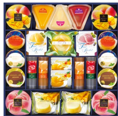
314 京都ラ・バンヴェント フルーツゼリー&プリン詰合せ

SAZ-60AS 物流No.402865 ケース入数:4 本体価格 6,000円 (税込価格 6,480円 ) JAN:4550557941692 寸法:D223×W390×H95mm ゼリー(北海道メロン×5・国産白桃×4・青森産りんご×5)各68g、手延素麺(紫芋・よもぎ・トマト・梅)各50g、讃岐素麺800g