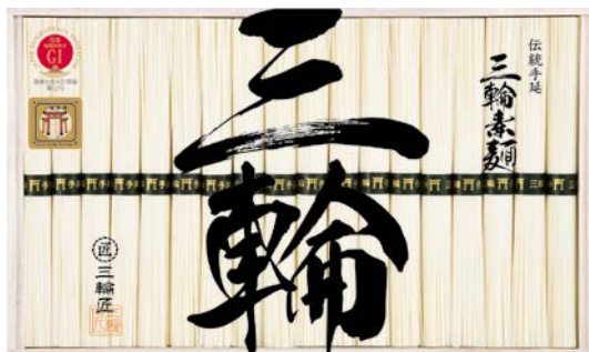
307 三輪手延素麺 鳥居帯ギフト