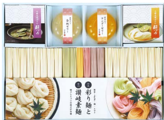
310 三輪匠 麺のつどいバラエティセット

GSI-40B 物流No.420278 ケース入数:10 本体価格 4,000円 (税込価格 4,320円 ) JAN:4580283003555 寸法:D220×W360×H34mm 手延素麺(白×3・紫いも×4・よもぎ×4・しょうが×4・トマト×3・うめ×3)各50g