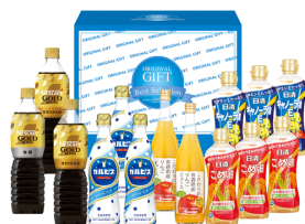
飲料&オイルバラエティギフ ト