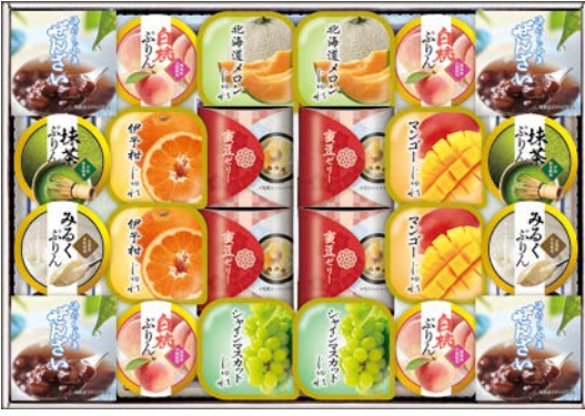
318 源楽製菓 和風菓子詰合せ

GT-50 物流No.879179 ケース入数:6 本体価格 5,000円 (税込価格) 5,400円 JAN:4520075010583 寸法:D300×W432×H46mm 冷やし小豆ぜんざい70g×4、ぷりん(白桃×4・抹茶×2・みるく×2)各45g、じゅれ(シャインマスカット・北海道メロン・伊予柑・マンゴー)各65g×各2、蜜豆ゼリー70g×4