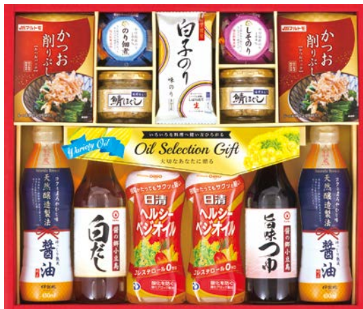
328 日清オイル&調味料バラエティギフト

KSN-100AS 物流No.410636 ケース入数:6 本体価格 10,000円 (税込価格 10,800円 ) JAN:4550557945508 寸法:D283×W417×H74mm キョクヨー紅ずわいがにほぐし90g×5、ニッスイ焼鮭ほぐし50g×2、牛肉と椎茸のしぐれ煮55g、柳川海苔本舗有明産焼海苔(2切8枚×2袋)