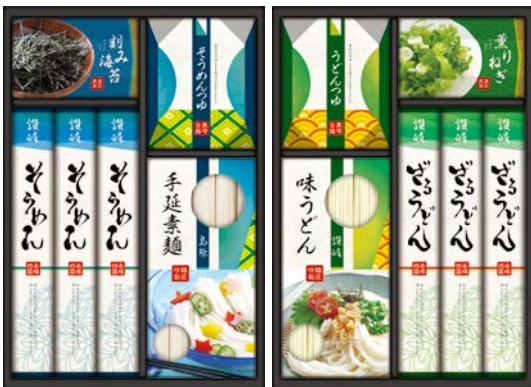
303 讃岐・島原麺づくしギフト