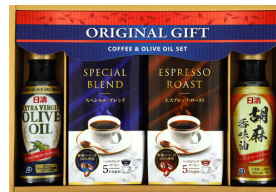
珈琲&オリーブオイルバラエティギフト