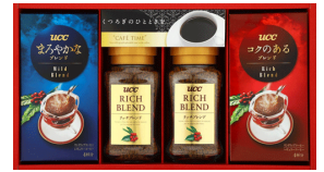
バラエティコーヒーギフト