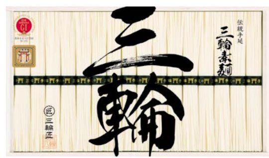
308 三輪手延素麺 鳥居帯ギフト