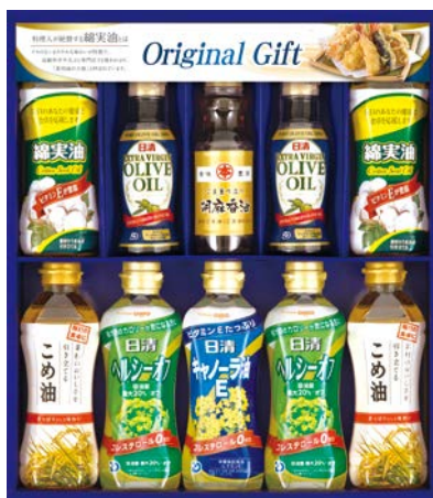
343 オイルセレクションギフト

SDD-60AS 物流No.102030 ケース入数:3 本体価格 6,000円 (税込価格 6,600円 ) JAN:4550557922066 寸法:D×W×Hmm NANOXone本体大型(スタンダード・ニオイ専用)各640g、香りつづくトップ抗菌(本体850g・詰替500g×3)、ブライストロング510ml、食器用洗剤オレンジ250ml×2、洗たく槽クリーナー、キッチンブリーチ