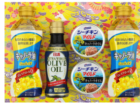
オリーブ&はごろもバラエティ