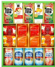
伊藤園・カルピスジュース& ゼリーギフト