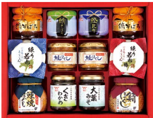
336 バラエティ珍味詰合せ

VTS-60AS 物流No.419190 ケース入数:5 本体価格 6,000円 (税込価格 6,480円 ) JAN:4550557898019 寸法:D255×W336×H80mm マルハニチロ(鮭昆布・鯖そぼろ)各45g、酒悦(大葉みそ115g・きわかめ80g)、鯖ほぐし60g、鮭焼ほぐしししゃも卵入り50g、鮭ほぐし40g×2、練り若布80g、練り若布梅80g、ニッスイ鶏そぼろ50g×2