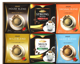
ユニカフェ&ハマヤコーヒ ーギフト