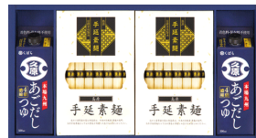
島原手延素麺&久原あごだし つゆ詰合せ