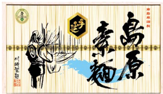
301 川崎 島原手延素麺ギフト