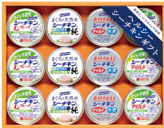
325 ヘルシーライフシーチキンギフト

CC-60AQ 物流No.282540 ケース入数:6 本体価格 6,000円 (税込価格) 6,480円 JAN:4550557388879 寸法:D366×W322×H111mm ソフトガトー(ヨーグルト&ブルーベリー×2、チーズ&レモン)、プチガトー(ストロベリー・ブルーベリー・オレンジ)×各2、ロシアケーキ(マカロンストロベリー・フラワーキウイ・リッチピター)×各2、檸檬のロシアケーキ×2、フルーツッキー(バナナチョコ×2・ストロベリー・オレンジ)、AGFちょっと贅沢な珈琲店スティックコーヒー(プレミアムマイルド・プレミアムピター)各7g×各7、杉本屋コーヒーゼリー58g×4、ネスカフェゴールドブレンド(無糖・甘さひかえめ)各720ml