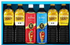
ネスカフェゴールドブレンド&味の素A G F飲料ギフト