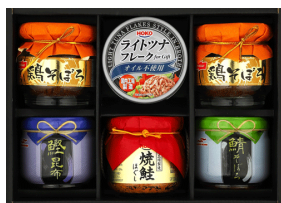
マルハニチロ & ニッスイシーフードバラエティギフト