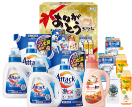
ありがとうギフト