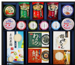
和の食卓&乾麺バラエティギフト