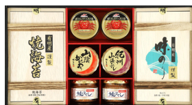
柳川海苔&海の幸詰合せ