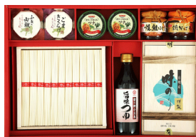
損保乃糸手延素麺バラエティ セット