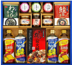
珍味&オイルバラエティギフト