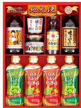
地元便 調味料バラエティセット