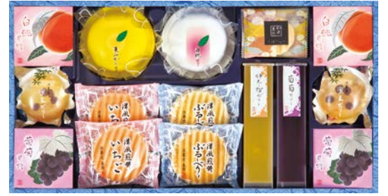
320 京菓匠善廣 和菓の極み

RTN-30 物流No.879216 ケース入数:6 本体価格 3,000円 (税込価格) 3,240円 JAN:4550454850981 寸法:D314×W379×H45mm 手延素麺色麺(紅紫蘇・トマト・生姜・よもぎ・青紫蘇・ブルーベリー・紫芋)各50g、金魚ゼリー55g×5、じゅれ(甘夏・白桃)各64g、京らむねゼリー64g×2、ほうじ茶寒天72g