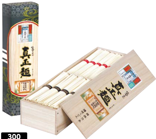
300 真正麺 揖保乃糸手延素麺・讃岐うどん詰合せ