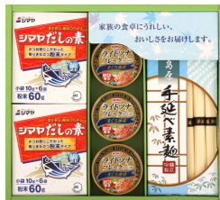
素麺&ツナ缶詰バラエティギフト