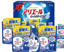
アリエール ホームクリーニ ングギフト