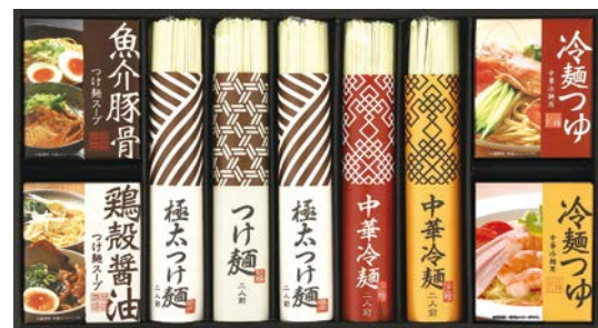
311 匠のつけ麺 中華麺セット

SGT-45B 物流No.420053 ケース入数:8 本体価格 4,500円 (税込価格 4,860円 ) JAN:4580283003524 寸法:D324×W442×H32mm 讃岐素麺50g×16、手延素麺(よもぎ×2・紫芋×2・梅・トマト)各50g、麺つゆ(15g×2袋)×2、ゼリー(白桃・マンゴー)各110g