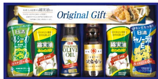
329 オイルセレクションギフト

SON-60AS 物流No.410637 ケース入数:4 本体価格 6,000円 (税込価格 6,480円 ) JAN:4550557945515 寸法:D368×W438×H79mm 日清ヘルシーベジオイル350g×2、マルキン(旨味つゆ・白だし)各360ml、伊賀越天然醸造醤油450ml×2、マルトモかつおパック(1.5g×4袋)×2、小豆島産佃煮(のりしそり)各80g、鯖ほぐし40g×2、白子味のり(8切5枚)×2