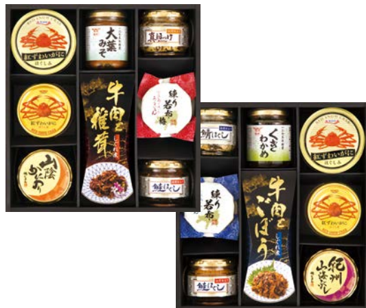
337 かに缶&酒悦&佃煮詰合せ

VTS-60AS 物流No.419190 ケース入数:5 本体価格 6,000円 (税込価格 6,480円 ) JAN:4550557898019 寸法:D255×W336×H80mm マルハニチロ(鮭昆布・鯖そぼろ)各45g、酒悦(大葉みそ115g・きわかめ80g)、鯖ほぐし60g、鮭焼ほぐしししゃも卵入り50g、鮭ほぐし40g×2、練り若布80g、練り若布梅80g、ニッスイ鶏そぼろ50g×2