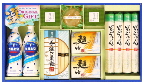
カルピス&そうめん&ゼリー 詰合せ