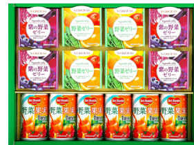
デルモンテ野菜ジュース &ゼリーギフト