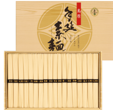
川崎 島原手延べそうめんギフト