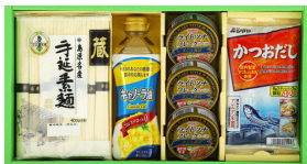
乾麺チャンプルギフト