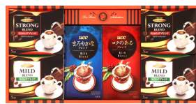
珈琲バラエティギフト