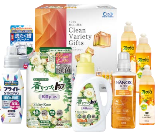
340 グリーンバラエティギフト

SDD-30AS 物流No.101966 ケース入数:6 本体価格 3,000円 (税込価格 3,300円 ) JAN:4550557922035 寸法:D139×W220×H268mm NANOXoneスタンダード本体大型640g、香りつづくトップ抗菌850g、ブライストロング510ml、食器用洗剤オレンジ250ml、洗たく槽クリーナー