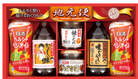
地元便 調味料バラエティセット