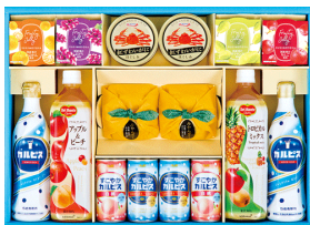
ファミリーバラエティギフト