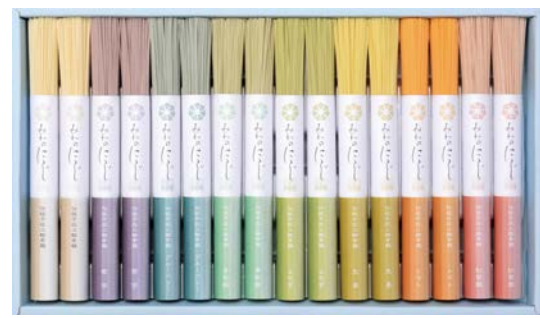
305 三輪そうめん小西 みわのにじ