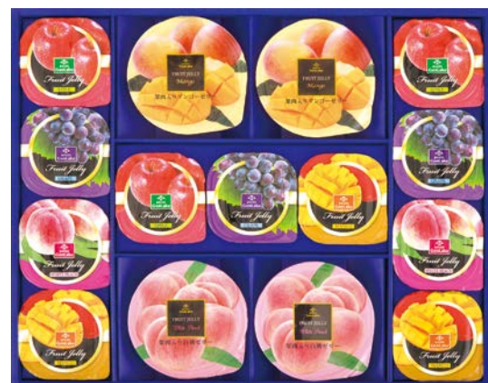
317 源楽製菓 フルーツデザート詰合せ

DNO-50C 物流No.420385 ケース入数:4 本体価格 5,000円 (税込価格 5,400円 ) JAN:4901818573600 寸法:D290×W403×H65mm 国産果汁ゼリー(りんご×4・いよかん×3・ぶどう×4・ラフランス×3)各58g、マンゴーゼリー57g×4、赤肉メロンゼリー58g×6