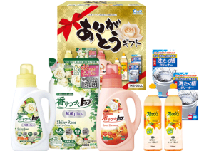
ありがとうギフト