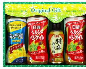
日清オイリオ&バラエティオイルギフト