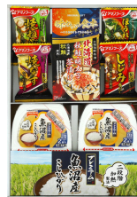
プレミアム簡単ごはんギフト