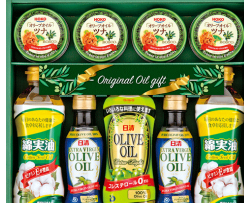
日清オリーブオイル&缶詰バラエティギフト