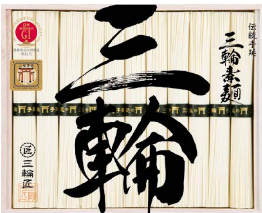
306 三輪手延素麺 鳥居帯ギフト

手延素麺100g、手延素麺色麺(紅紫蘇・トマト・生姜・よもぎ・青紫蘇・ブルーベリー・紫芋)各100g