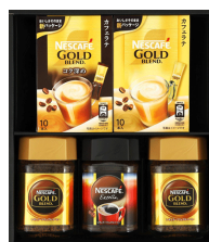
ネスカフェゴールドブレンド & エクセラギフト