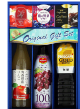
飲料バラエティギフト