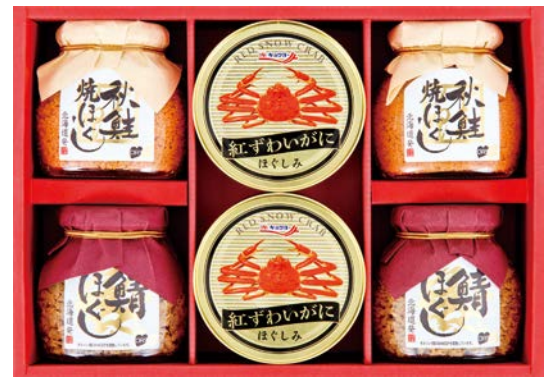
326 シーフードバラエティギフト

SHG-30 物流No.287310 ケース入数:8 本体価格 3,000円 (税込価格) 3,240円 JAN:4902560269100 寸法:D253×W328×H51mm 素材そのままシーチキンマイルド・まぐろと天然水だけのシーチキン純・オイル不使用シーチキンマイルド・オイル不使用シーチキンLフレック各70g×各3