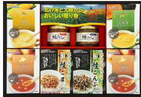
北海道発バラエティギフト