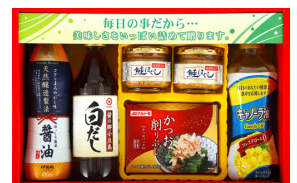
調味料セレクトギフト