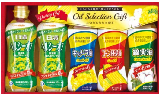
331 キャノーラ油&コーン油ギフト

P-20 物流No.52516 ケース入数:8 本体価格 2,000円 (税込価格 2,160円 ) JAN:4550557882148 寸法:D313×W283×H63mm 日清(ヘルシーオフ350g・ヘルシーベジオイル350g・胡麻香油145g)、鳴門の塩80g、マルトモだしの素(4g×6袋)、お吸い物(3g×5袋)