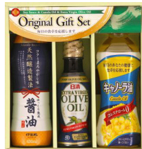
オリーブ油&天然醸造醤油ギフト