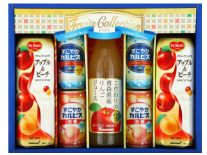
青森リンゴジュース&デルモンテ果汁飲料ギフト