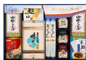
柳川海苔&ファミリーギフト