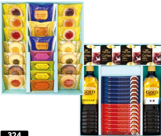
324 AGF&ネスカフェゴールドブレンド&東京渋谷プレザー コーヒーブレイクセット

SKD-45AS 物流No.419678 ケース入数:4 本体価格 4,500円 (税込価格) 4,860円 JAN:4550557898088 寸法:D398×W426×H50mm 杉本屋赤肉メロンゼリー58g×4、杉本屋国産果汁ゼリー(ぶどう・ラフランス)各58g、フルーツゼリー(グレープ・アップル)各62g×各2、果肉入りゼリー(みかん×2・ピーチ)各105g、杉本屋マンゴーゼリー58g×2、FRUITS SELECTION果汁100%ジュース(グレープ・フルーツセブン・オレンジ・アップル)各200ml×各2