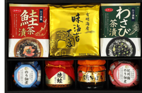
有明海産海苔&白子のり茶漬 バラエティギフト