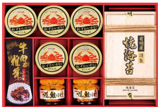
327 紅ずわいがに&海苔&しぐれ煮 バラエティ

KSN-100AS 物流No.410636 ケース入数:6 本体価格 10,000円 (税込価格 10,800円 ) JAN:4550557945508 寸法:D283×W417×H74mm キョクヨー紅ずわいがにほぐし90g×5、ニッスイ焼鮭ほぐし50g×2、牛肉と椎茸のしぐれ煮55g、柳川海苔本舗有明産焼海苔(2切8枚×2袋)