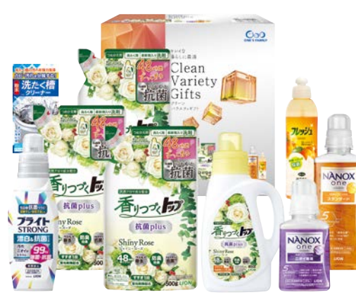
341 グリーンバラエティギフト

SDD-40AS 物流No.101973 ケース入数:4 本体価格 4,000円 (税込価格 4,400円 ) JAN:4550557922042 寸法:D×W×Hmm NANOXoneスタンダード本体大型640g、香りつづくトップ抗菌(本体850g・詰替500g)、ブライストロング510ml、食器用洗剤オレンジ250ml×3、洗たく槽クリーナー