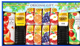
ネスレ&デルモンテ飲料ギフト