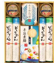
素麺&ツナ缶ギフト