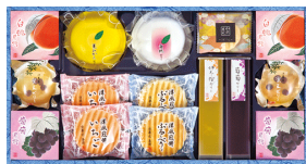
京菓匠善廣 和菓の極み