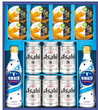
アサヒビール&カルピスバラエティギフト