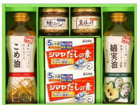
調味料ギフトセット