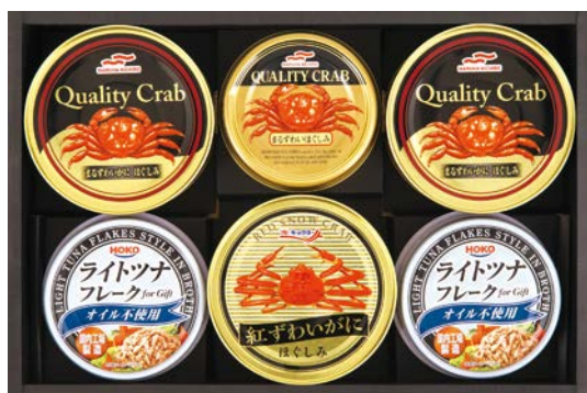
333 マルハニチロ&キョクヨー かにバラエティギフト

NKT-30CQ 物流No.349187 ケース入数:8 本体価格 3,000円 (税込価格 3,240円 ) JAN:4550557406481 寸法:D217×W429×H66mm 日清キャノーラ油E350g×2、綿実油350g×2、キッコーマンいつでも新鮮しぼりたて生しょうゆ200ml×2