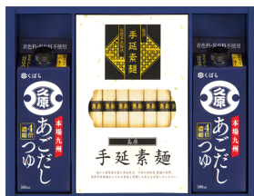
島原手延素麺&久原あごだし つゆ詰合せ