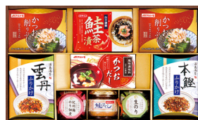
白子のり&マルトモ&バラエ ティギフト