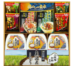
プレミアム簡単ごはんギフト