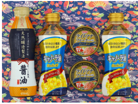
ツナ缶&油ファミリーギフト