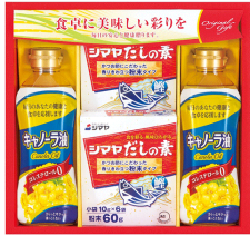
キャノーラ油&調味料ギフト