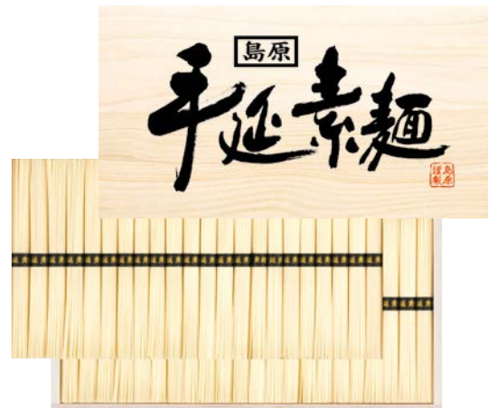
302 島原手延素麺ギフト