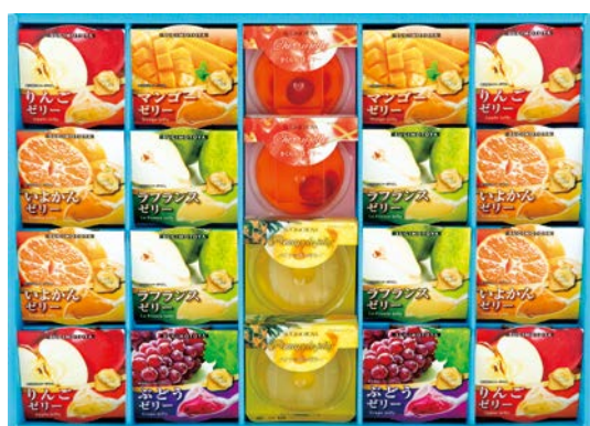
315 杉本屋 フルーツゼリーギフト

LBD-60G 物流No.995198 ケース入数:5 本体価格 6,000円 (税込価格 6,480円 ) JAN:4520075010187 寸法:D436×W441×H48mm マンゴープリン75g×2、カスタードプリン75g×2、ムース(チーズ・チョコ)各75g×各2、マンゴーゼリー45g×2、シャーベット(グレープ・オレンジ)各64g、筒ゼリー(黄桃・りんご)各95g×各2、フルーツゼリー126g、三角カップ(グレープ・ピーチ・マンゴー)各105g、果肉入りゼリー(マンゴー・白桃)各110g×各2