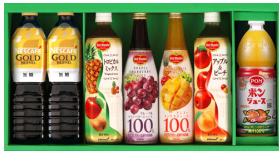
バラエティ飲料ギフト