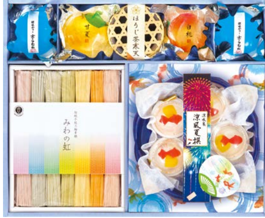
319 みわの虹&涼菓子詰合せ

GT-50 物流No.879179 ケース入数:6 本体価格 5,000円 (税込価格) 5,400円 JAN:4520075010583 寸法:D300×W432×H46mm 冷やし小豆ぜんざい70g×4、ぷりん(白桃×4・抹茶×2・みるく×2)各45g、じゅれ(シャインマスカット・北海道メロン・伊予柑・マンゴー)各65g×各2、蜜豆ゼリー70g×4