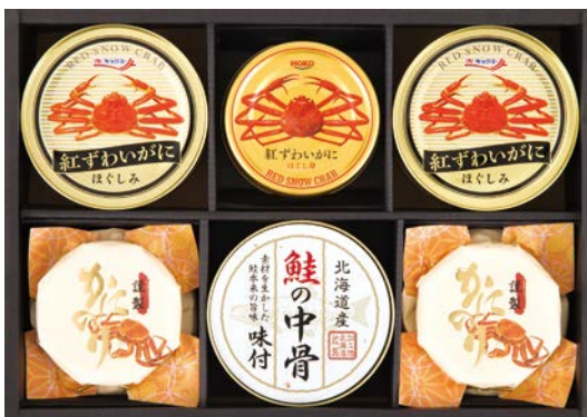
334 シーフードバラエティギフト

GH-50TR 物流No.112381 ケース入数:8 本体価格 5,000円 (税込価格 5,400円 ) JAN:4550557664355 寸法:D181×W269×H53mm マルハニチロまるげわいがにほぐし(100g×2・55g)、キョクヨー紅ずわいがにほぐし身90g、宝幸ライトツナフレークオイル不使用70g×2