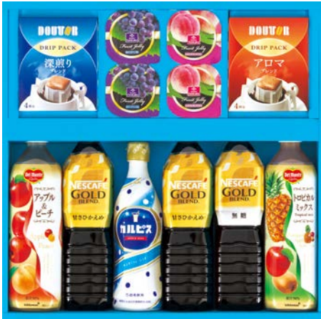
321 飲料バラエティギフト

YH-30G 物流No.991819 ケース入数:8 本体価格 3,000円 (税込価格) 3,240円 JAN:4520075009952 寸法:D249×W471×H50mm 葛餅(葡萄・白桃)各70g×各2、ゼリー(夏みかん・白桃)各135g、洋風煎餅(いちご・ぶるべりー)各2枚入×各2、和菓煎餅ばいら×2、蜜豆ゼリー64g×2、四角筒ゼリー(伊予柑・葡萄)各125g