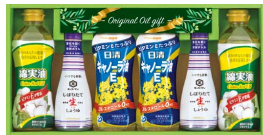
332 日清キャノーラ油&調味料 バラエティギフト

VG-25TQ 物流No.349190 ケース入数:8 本体価格 2,500円 (税込価格 2,700円 ) JAN:4550557406504 寸法:D216×W373×H58mm キャノーラ油350g、コーン油350g、綿実油350g、日清ヘルシーオフ350g×2