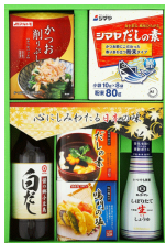
調味料バラエティギフト