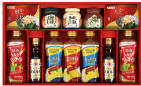
調味料バラエティギフト