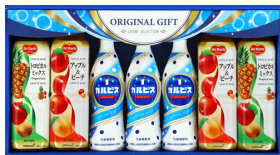
カルピス&バラエティ飲料ギフト