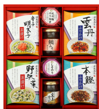
磯じまん&ふりかけバラエ ティギフト