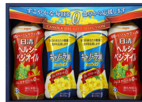
日清ヘルシーベジオイル&キャノーラ油バラエティギフト