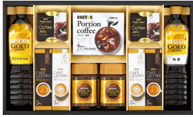
ネスカフェゴールドブレンド &コーヒーゼリーギフト