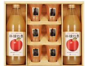
青森県津軽産りんごジュース &ゼリーギフト