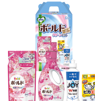
ボールドクリーンセット