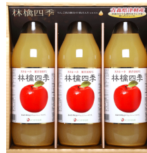
青森県津軽産りんごジュース100%ギフト