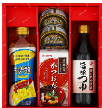
宝幸&キャノーラ油ギフト