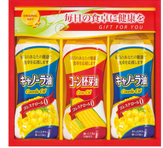
キャノーラ&コーンオイルギフト