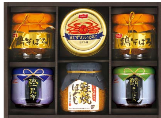
335 マルハニチロ&ニッスイ シーフードバラエティギフト

MHH-50AS 物流No.419540 ケース入数:6 本体価格 5,000円 (税込価格 5,400円 ) JAN:4550557898040 寸法:D190×W275×H56mm キョクヨー紅ずわいがにほぐし身90g×2、宝幸紅ずわいがにほぐし身55g、鮭の中骨味付170g、かにのり80g×2