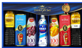
カルピス&デルモンテ飲料バラエティギフト