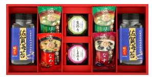
佐賀海苔&バラエティギフト