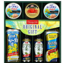
日清オイル&はごろもシー フードギフト