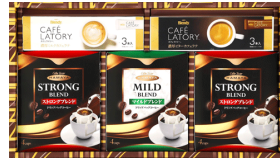
コーヒーバラエティギフト