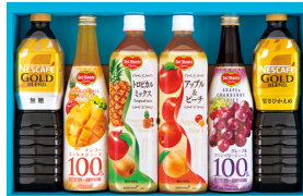
飲料バラエティギフト