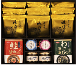
サン海苔&和の食卓詰合せ