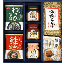
浦島海苔&バラエティセット