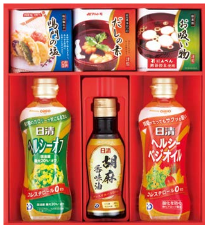
330 バラエティ調味料セット

VK-30 物流No.111744 ケース入数:6 本体価格 3,000円 (税込価格 3,240円 ) JAN:4550557664089 寸法:D218×W435×H60mm 日清(ヘルシーオフ350g・キャノーラ油E350g・エキストラバージンオリーブオイル145g)、マルホン胡麻香油150g、綿実油350g×2