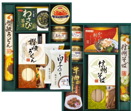
312 信州そば&讃岐うどん&シーフードバラエティギフト

DTC-40F 物流No.420068 ケース入数:10 本体価格 4,000円 (税込価格 4,320円 ) JAN:4580283003609 寸法:D263×W475×H42mm つけ麺180g、極太つけ麺180g×2、つけ麺スープ(鶏殻醤油(27g×4袋)・魚介豚骨(40g×2袋))、中華冷麺180g×2、冷麺つゆ(50g×2袋)×2