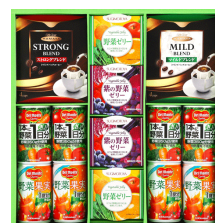
デルモンテ野菜ジュース&ゼ リーギフト