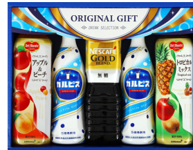
カルピス&バラエティ飲料ギフト