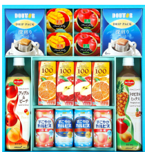
デルモンテ&珈琲バラエティ ギフト