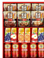
麒麟本麒麟&珍味&10 0%ジュースギフト