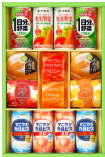
伊藤園・カルピスジュース& ゼリーギフト