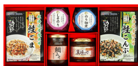
磯じまん&ふりかけバラエ ティギフト