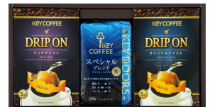
コーヒーバラエティギフト