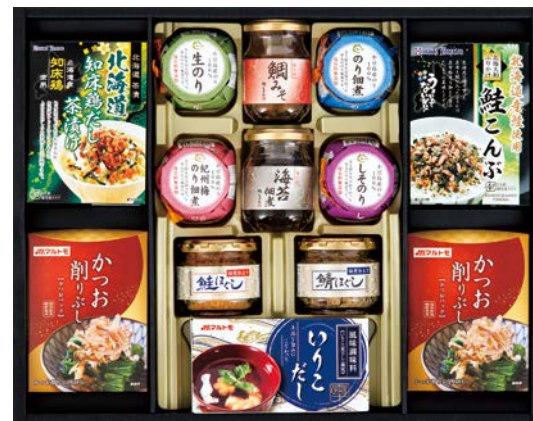
338 磯じまん&マルトモバラエティギフト

CAN-100AS 物流No.420132 ケース入数:4 本体価格 10,000円 (税込価格 10,800円 ) JAN:4550557949452 寸法:D260×W279×H146mm キョクヨー紅ずわいがにほぐし90g×2、牛肉と椎茸のしぐれ煮55g、牛肉とごぼうのしぐれ煮55g、練り若布・練り若布梅各80g、宝幸紅ずわいがにほぐし身55g×2、鮭ほぐし40g×2、鯖ほぐし40g、真ほつけ焼きほぐし40g、酒悦(きわかめ80g・大葉みそ115g)、磯じまん(紀州山海がし・山陰かにのり)各135g