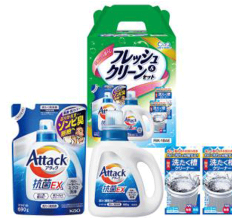
フレッシュ&クリーンセット