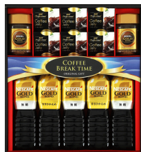
ネスカフェゴールドブレンド & コーヒーゼリーギフト