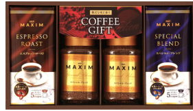
マキシム&コーヒーギフト