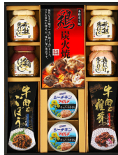
はごろも & 牛肉しぐれ煮詰合せ