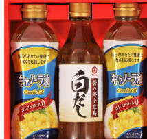
キャノーラ油&調味料ギフト