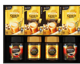
ネスカフェゴールドブレンド & エクセラギフト