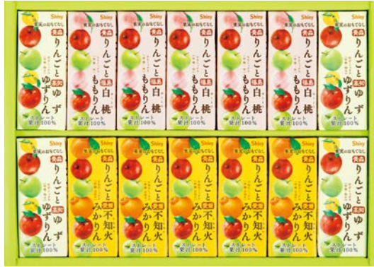
322 国産果汁100%ジュースセレクション

VOS-50AS 物流No.419208 ケース入数:3 本体価格 5,000円 (税込価格) 5,400円 JAN:4550557898026 寸法:D442×W441×H79mm ゼリー(グレープ・ピーチ)各62g×各2、ドールドリップパック(アロマブレンド・深煎りブレンド)各7g×各4P、デルモンテ(アップル&ピーチ・トロピカルミックス)各920g、ネスカフェゴールドブレンド(無糖・甘さひかえめ×2)各720ml、カルピス470ml