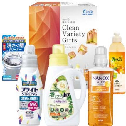
339 グリーンバラエティギフト

IWH-50AS 物流No.410638 ケース入数:6 本体価格 5,000円 (税込価格 5,400円 ) JAN:4550557945522 寸法:D332×W430×H79mm 磯じまん(海苔佃煮90g・鯛みそ100g)、小豆島産佃煮(生のり・紀州梅のり・のり・しそり)各80g、鯖ほぐし40g、鮭ほぐし40g、マルトモ(いりこだし8g×5袋・かつおパック1.5g×4袋×2)、北海道知床鶏だし茶漬け9g×3袋、鮭こんぶふりかけ3g×4袋