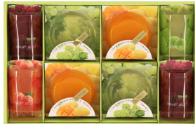
ありがとうギフト (フルーツゼリー)