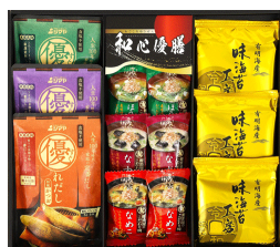
フリーズドライ&海苔ギフト