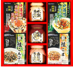
北海道発バラエティギフト