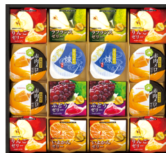
杉本屋 サマーゼリーアソ ト