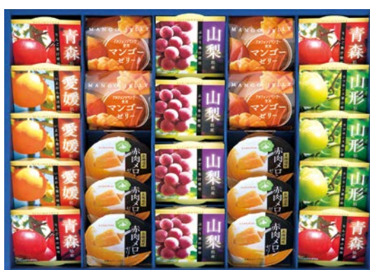
316 杉本屋 夏の音

DFZ-40 物流No.420287 ケース入数:6 本体価格 4,000円 (税込価格 4,320円 ) JAN:4901818573594 寸法:D300×W422×H55mm フルーツゼリー(りんご×4・いよかん×4・ラフランス×4・マンゴー×2・ぶどう×2)各58g、果肉入りゼリー(パイン・チェリー)各58g×各2