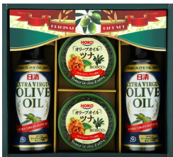
オリーブ&ツナ缶ギフト