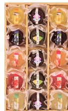
ありがとうギフト (ゼリー&ようかん詰合せ)