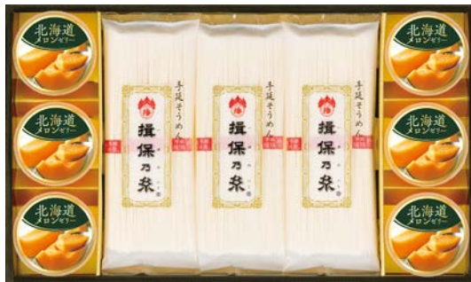
304 揖保乃糸&北海道メロンゼリーギフト

讃岐そうめん180g×3、島原手延素麺300g、刻み海苔4g、そうめんつゆ(12ml×8袋)、讃岐(ざるうどん180g×3・味噌うどん320g)、薫りねぎ(0.6g×2袋)、うどんつゆ(12ml×8袋)