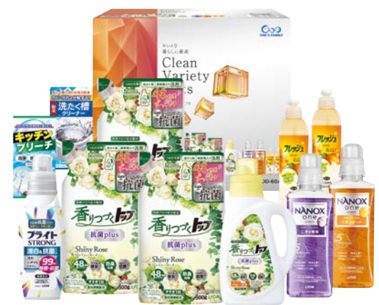
342 グリーンバラエティギフト

SDD-50AS 物流No.101987 ケース入数:3 本体価格 5,000円 (税込価格 5,500円 ) JAN:4550557922059 寸法:D×W×Hmm NANOXone(スタンダード本体大型640g・ニオイ専用本体380g)、香りつづくトップ抗菌(本体850g・詰替500g×3)、ブライストロング510ml、食器用洗剤オレンジ250ml、洗たく槽クリーナー