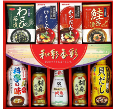
朝食バラエティギフト